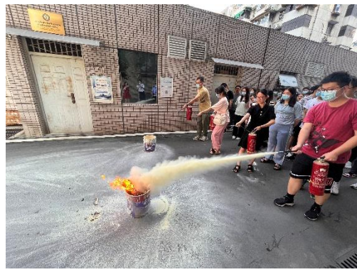
口腔教学实验安全教育课程